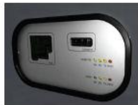
2. Automatic urine reader for 11 parameters determination / Automatic reader for cassette rapid tests Lettore automatizzato di strisce urine per la determinazione di 11 parametri.